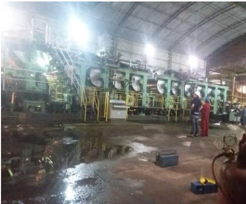
Preparo de Massa